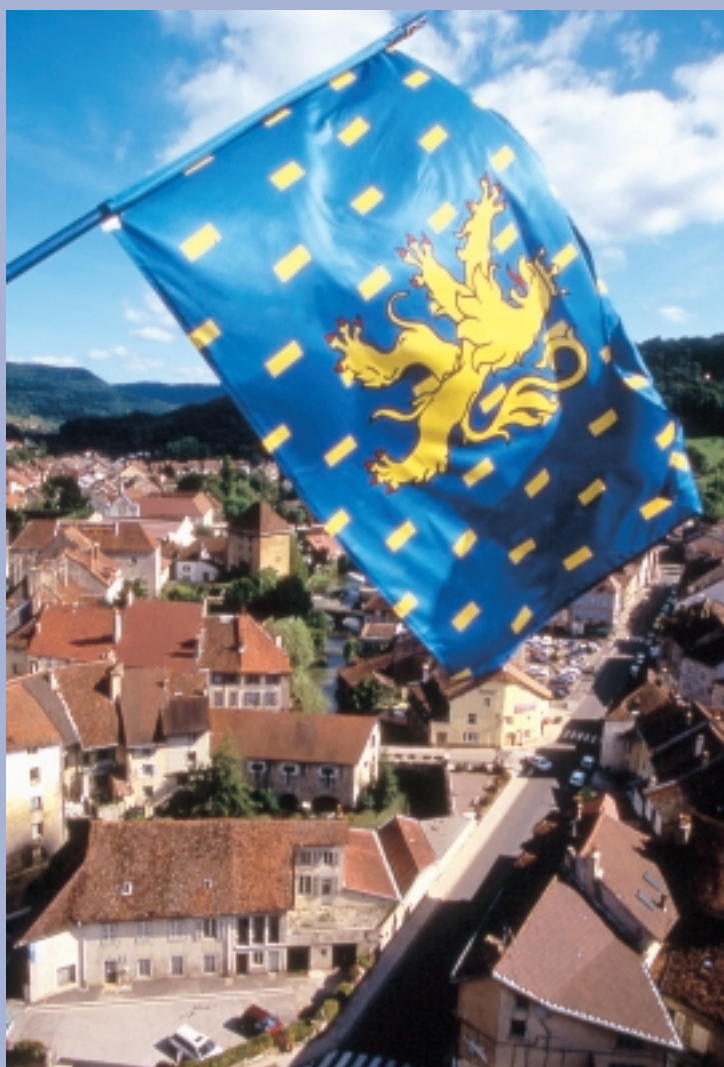
Drapeau franc-comtois à Arbois (Jura)