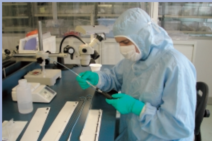
ALCIS, lauréate du Concours National Entreprise Innovante en 1999